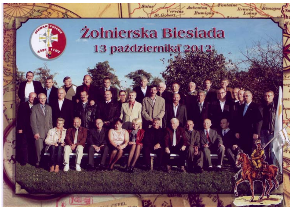
Żołnierska Biesiada – spotkanie koleżeńskie 13.10.2012 r.