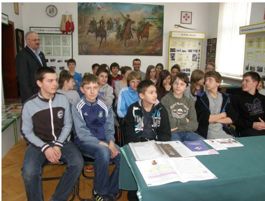
Spotkanie z gimnazjalistami w Izbie Tradycji Żarskiego Garnizonu w MBP.