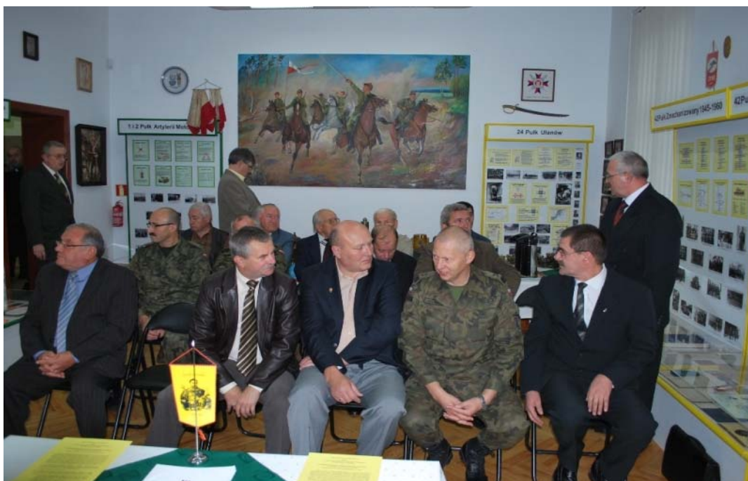
Spotkanie koleżeńskie w Izbie Tradycji