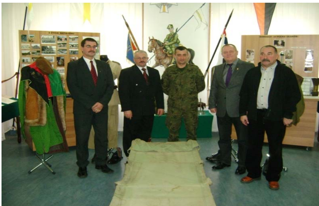
W Sali Tradycji 24. batalionu ułanów 10. B.KPanc. w Świętoszowie.