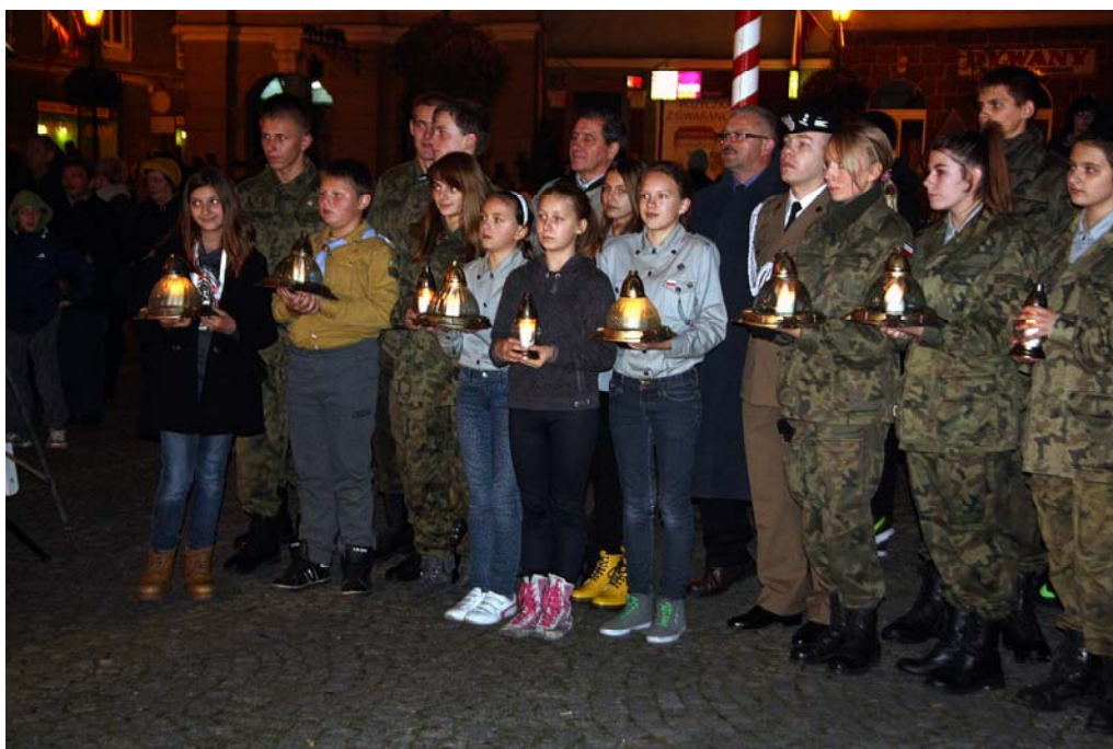
Narodowe Święto Niepodległości 10.11.2012 r. – żarski Rynek