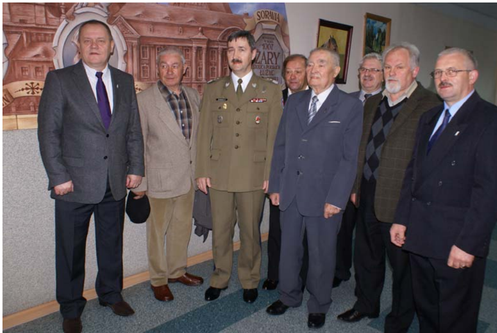
Członkowie stowarzyszenia w Żarskim Ratuszu.

„Żołnierz ogarnia pamięcią te chwile i zdarzenia, w których czuł się najlepiej i był potrzebny”