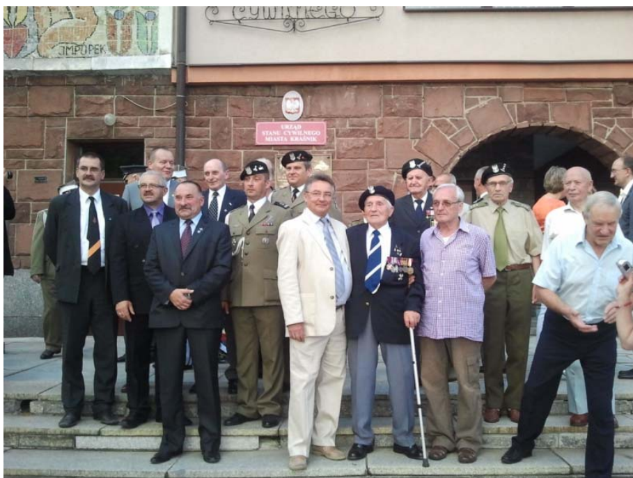
Święto 24 Pułku Ułanów w Kraśniku 07.07.2012 r.