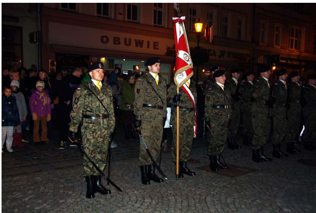
Kompania honorowa 24 Batalionu Ułanów im. H.W.K. Stanisława Żółkiewskiego ze Świątoszowa. - żarski Rynek – Narodowe Święto Niepodległości 10.11.2012r.