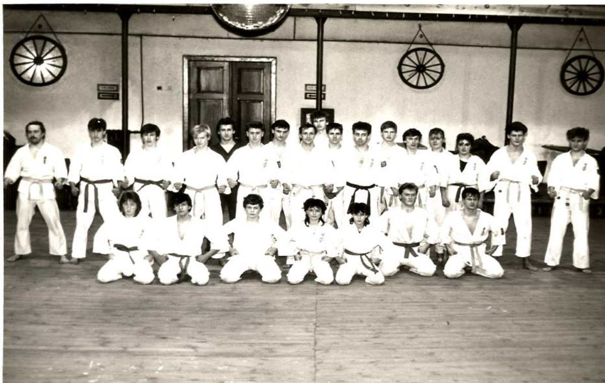
CKM KONIEC LAT 80

ŻKSK to stowarzyszenie kultury fizycznej oraz organizacja non profit które zrzesza sympatyków sztuki karate oraz osoby, które pragną aby młodzież siedząca w domach lub na podwórkach mogła po przez treningi sztuki karate znaleźć sobie zajęcie, które efektywnie spożytkuje ich czas, da sprawność fizyczną, pewność siebie, samodyscyplinę, nabędą umiejętności, które w przypadku zagrożenia życia lub zdrowia będą mogli wykorzystać. ŻKSK idzie w czterech kierunkach rozwoju członków klubu karate jako sztuka, sport, samoobrona, rekreacja