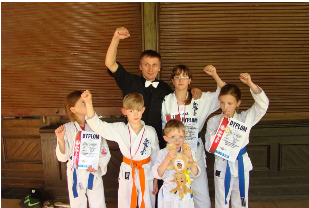
Między Narodowy Puchar Sudetów Szczawno-Zdrój 8.06.2013

W ciągu tych trzydziestu lat działalności klubu przez jego szeregi przewinęło się setki ćwiczących a można powiedzieć że i parę tysięcy osób .Zdobyto wiele medali pucharów wyszkolono wielu świetnych zawodników którzy zakończyli lub poszli swoją drogą ale mają kontakt z klubem , zawodnicy ci godnie reprezentowali klub i miasto Żary na arenie sportowej