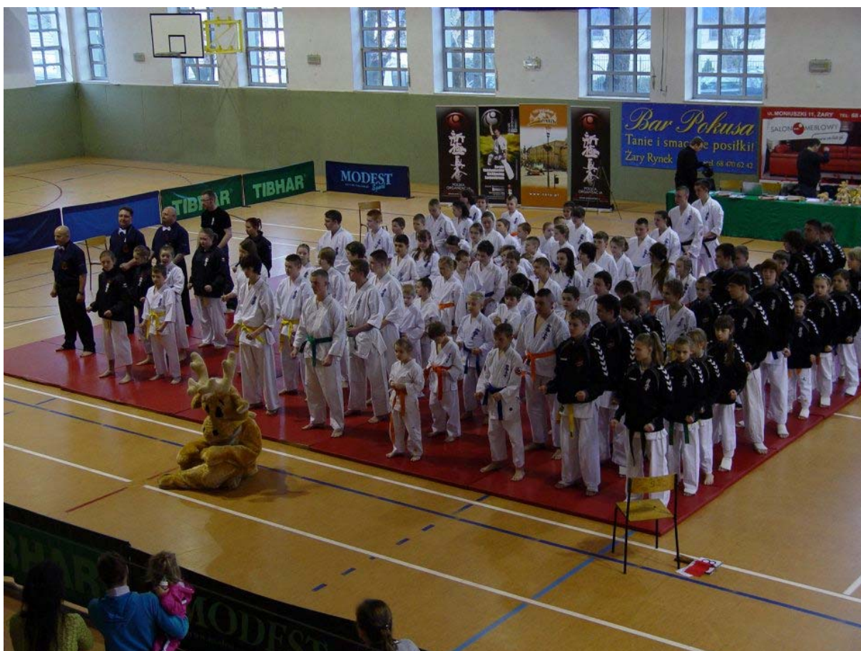
Mistrzostwa Dolnych Łużyc Shinkyokushin Karate- Liga Dolnośląska Żary 4.04.2013